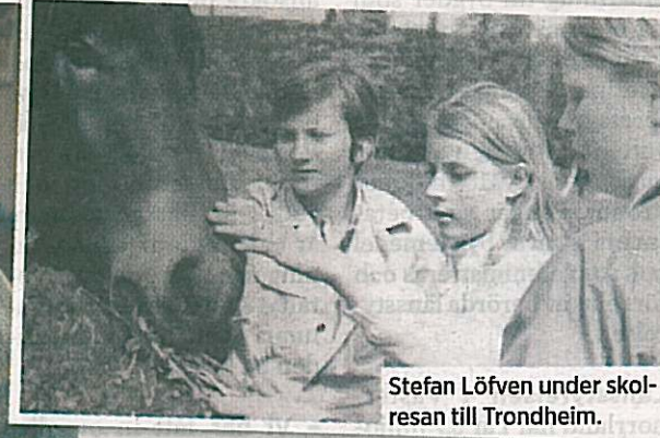
Stefan Löfven under skolresan till Trondheim.

Läraren och eleven hade mycket att tala om. Läraren fick också beröm för en ro-