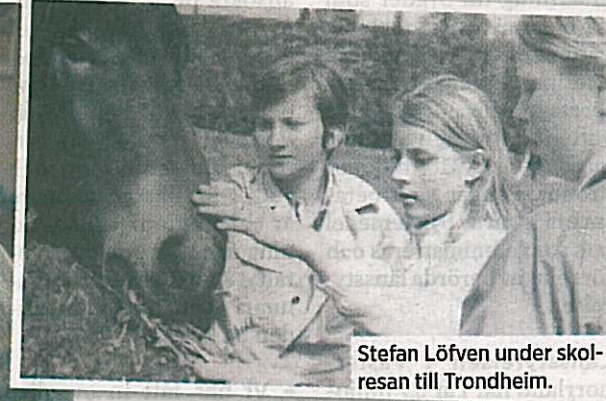
Stefan Löfven under skolresan till Trondheim.

Läraren och eleven hade mycket att tala om. Läraren fick också beröm för en ro-